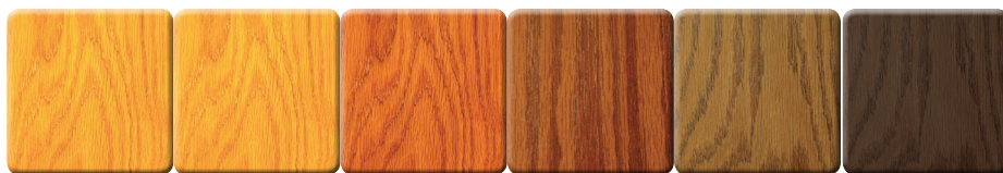
MANDULA FENYŐ FENYŐ